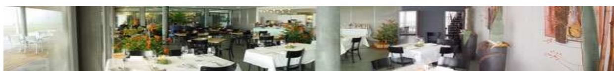
Restaurant Golfpark Moossee

Betreiberin des Restaurant Golfpark Moossee ist die Rotonde AG mit Sitz in Biel. Sie betreibt in Biel, Nidau und Münchenbuchsee mehrere Restaurationsbetriebe. In Nidau sind dies das Restaurant La Peniche direkt am wunderschönen Bielersee und das Stadthaus im Zentrum des Städtchens. In Biel die Brasserie la Rontonde, das Restaurant L' Arcade im Herzen der Stadt, im Kongresszentrum das Restaurant Kongresshaus und das Strandbad von Biel, das Restaurant La Plage. Ebenfalls betreiben wir einen Catering Service. Sie laden ein. Sie sagen, was es sein darf. Wir sorgen für alles in Top – Qualität. Und Sie haben Zeit für Ihre Gäste. Kluges Timing, interessante Gäste, spannender Gesprächsstoff und gute Atmosphäre. Wenn sich all diese Faktoren in Einklang bringen lassen, wird ein Catering zum Erfolg. Gerne stellen wir für Sie eine Offerte zusammen.