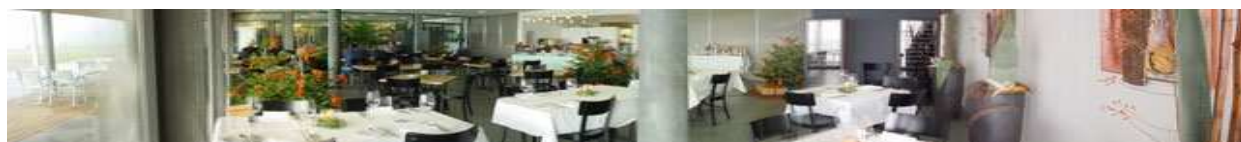
Restaurant Golfpark Moossee